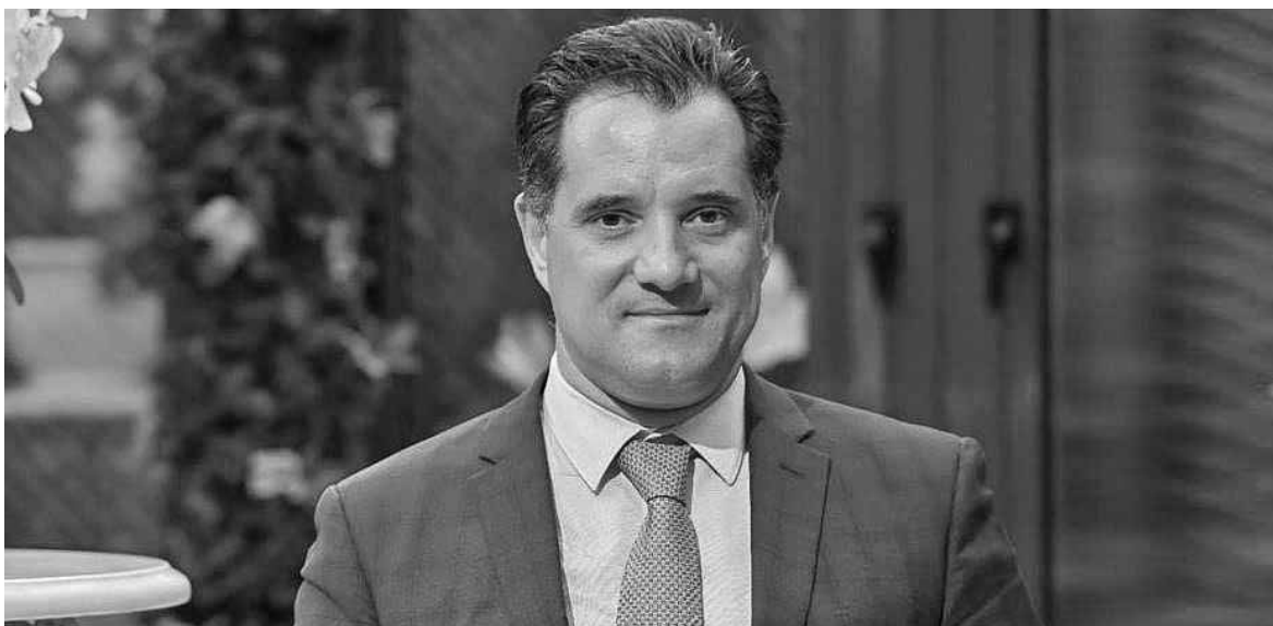
Ο υπουργός Ανάπτυξης και Επενδύσεων Άδωνις Γεωργιάδης

Ε ίναι απολύτως ρεαλιστικό να αρχίσουν τα έργα στο τέλος του έτους, τόνισε για την επένδυση στο Ελληνικό, ο υπουργός Ανάπτυξης και Επενδύσεων Άδωνις Γεωργιάδης, ενώ συμπλήρωσε πως είναι κάτι που εξαρτάται και από την εταιρεία.