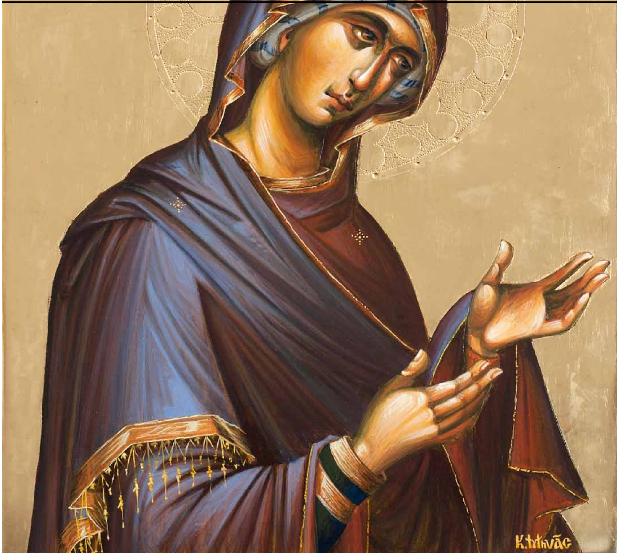
Μηνάς Κωνσταντίνος, «Παναγία Δεομένη», βυζαντινή αιογραφία με στιλβωτό χρυσό σε ξύλο, σκαλιστό φωτιστέφανο με την τεχνική του τσοουκάνικου, αυγοτέμπερα, 45x35

T: 210 38 17 700 - 210 38 17 716 - 210 38 17 737 F: 210 38 17 331 - 210 38 17 281 E: iho@otenet.gr W: www.ihodimoprasion.gr