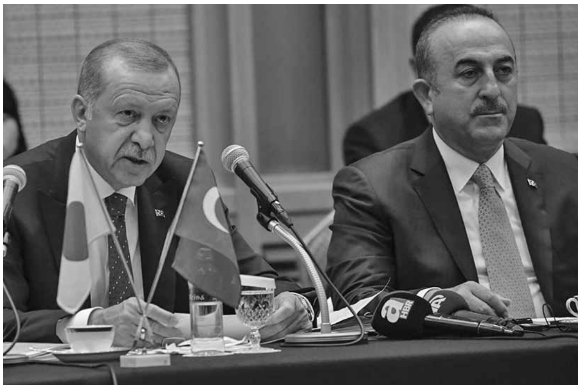
Ο Ρετζέπ Ταγίπ Ερντογάν με τον Τούρκο ΥΠΕΞ Μεβλούτ Τσαβούσογλου.

« Ε πειτα από τη συνομιλία μου με τον Ντόναλντ Τραμπ, η απόσυρση των αμερικανικών στρατευμάτων από τη ζώνη στα σύνορα με τη Συρία έχει ξεκινήσει» επιβεβαίωσε ο Ρετζέπ Ταγίπ Ερντογάν σε δηλώσεις του στον τουρκικό Τύπο, κατά την αναχώρησή του για τη Σερβία, όπου έχει προγραμματίσει επίσκεψη.