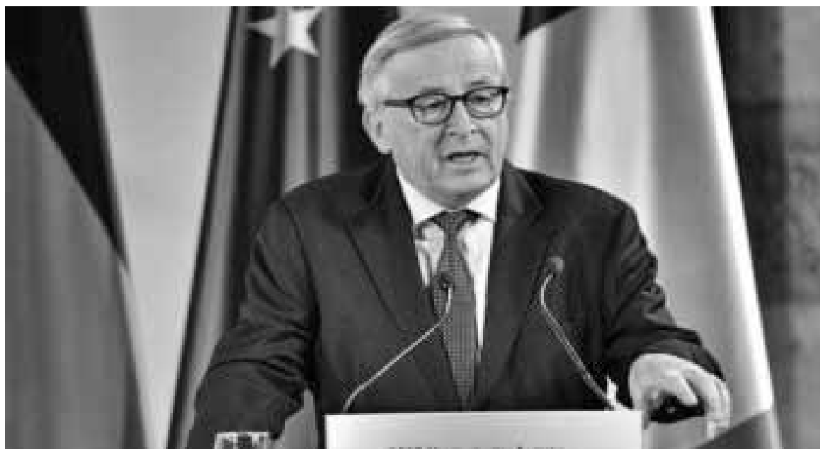
Ο απερχόμενος πρόεδρος της Ευρωπαϊκής Επιτροπής Ζαν-Κλοντ Γιούνκερ.

Π επεισμένος ότι ο Αμερικανός πρόεδρος Ντόναλντ Τραμπ δεν θα επιβάλλει τις προσεχείς ημέρες νέους, επιπρόσθετους δασμούς στα ευρωπαϊκά αυτοκίνητα που εισάγονται στη χώρα του δήλωσε ο απερχόμενος πρόεδρος της Ευρωπαϊκής Επιτροπής Ζαν-Κλοντ Γιούνκερ.