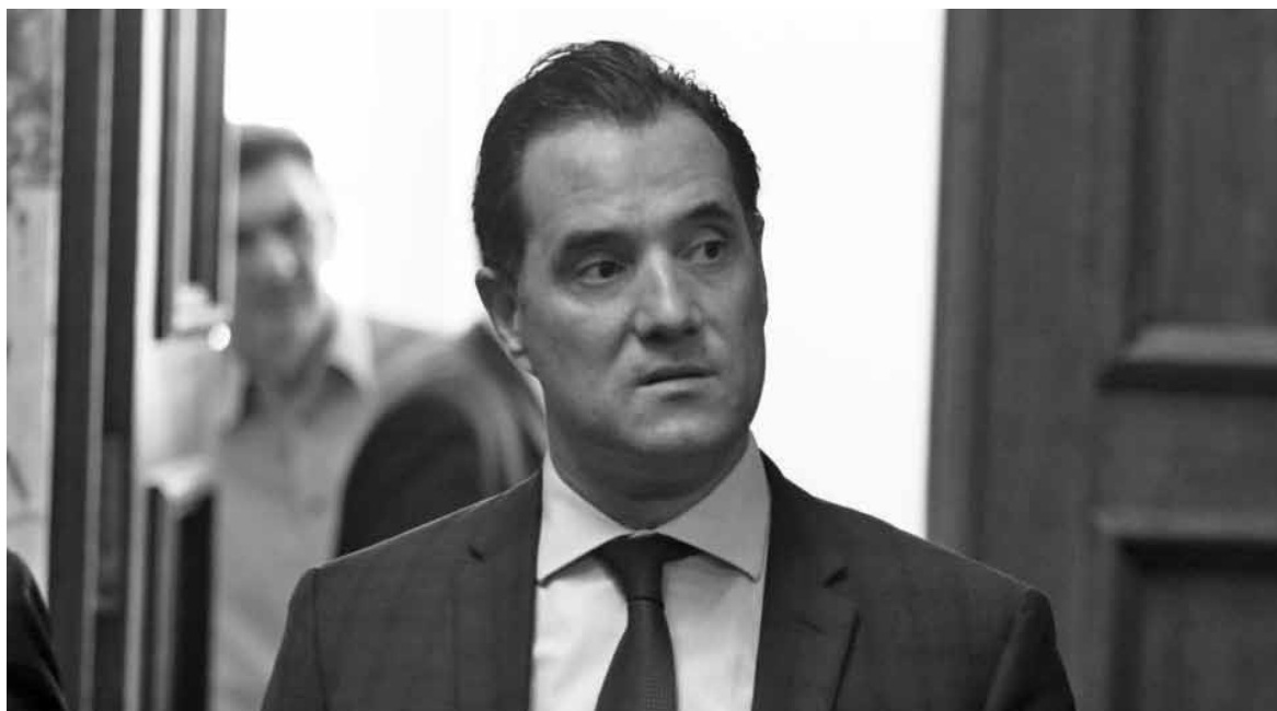
Ο υπουργός Ανάπτυξης και Επενδύσεων, Αδωνις Γεωργιάδης.

Καμία εμπλοκή στην έφοδο στις τράπεζες δεν έχει το υπουργείο Ανάπτυξης και Επενδύσεων, υπογράμμισε ο Αδωνις Γεωργιάδης. Ο υπουργός Ανάπτυξης και Επενδύσεων ξεκαθάρισε ότι την απόφαση για την έφοδο πήρε η Επιτροπή Ανταγωνισμού που είναι εντελώς ανεξάρτητη.