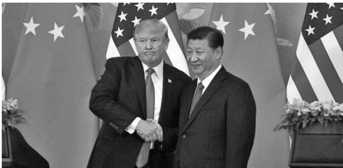
Ο πρόεδρος Ντόναλντ Τραμπ και Σι Τζινπίνγκ.

Η κυβέρνηση των ΗΠΑ είναι «πάρα πολύ αισιόδοξη» για την προοπτική επίτευξης συμφωνίας με αυτή της Κίνας για το εμπόριο «σύντομα», δήλωσε η εκπρόσωπος του Λευκού Οίκου Στέφανι Γκρίσαμ στο τηλεοπτικό δίκτυο Fox News.