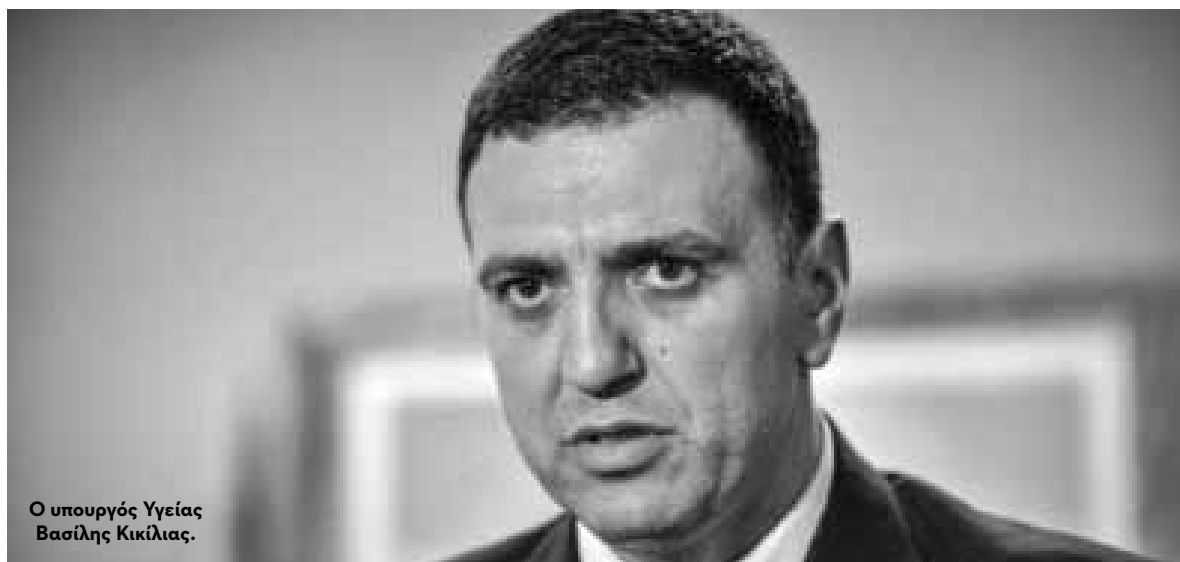
Ο υπουργός Υγείας Βασίλης Κικιλίας.

Τ ην ανάγκη να δουν οι Έλληνες ασφαλισμένοι μείωση στη συμμετοχή τους στην αγορά των φαρμάκων που έχουν ανάγκη, επισήμανε χθες ο υπουργός Υγείας Βασίλης Κικιλίας στην ημερίδα "Clawback και Φαρμακευτική Δαπάνη". Στην τοποθέτησή του είπε ότι το υπουργείο Υγείας "θα νομοθετήσει στη Βουλή, τις μηδενικές αυξήσεις στα φάρμακα για το 2020 και 7% μειώσεις, έναντι 10% αυξήσεις και 10% μειώσεις που κληρονόμησε από τον τελευταίο νόμο".