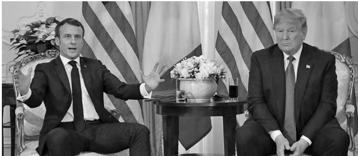
Η κόντρα του Εμανουέλ Μακρόν με τον Ντόναλντ Τραμπ.

Μπροστά στις κάμερες ξεκίνησε η κόντρα του Εμανουέλ Μακρόν με τον Ντόναλντ Τραμπ. Οι δύο ηγέτες συναντήθηκαν στο περιθώριο της Συνόδου του ΝΑΤΟ στο Λονδίνο, την ώρα που η ένταση μεταξύ των δύο χωρών κορυφώνεται. Κατά τη διάρκεια της συνάντησης, ο Εμανουέλ Μακρόν ρωτήθηκε για τους φυλακισμένους τζιχαντιστές του ISIS και την επιστροφή τους στην Ευρώπη.