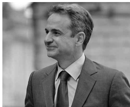
Ο πρωθυπουργός Κυριάκος Μητσοτάκης.

Στη συζήτηση που έγινε αναδείχθηκαν οι τομείς των «πράσινων» επενδύσεων, των υποδομών, του τουρισμού και