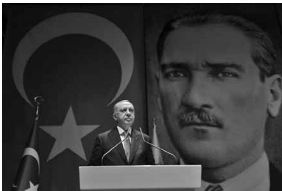
Ο Ρετζέπ Ταγίπ Ερντογάν.

Η συμφωνία Τουρκίας-Λιβύης μπορεί να αλλάξει τους συσχετισμούς δυνάμεων στην ανατολική Μεσόγειο υπέρ της Άγκυρας και εις βάρος της Ελλάδας, σημειώνει η Welt «υπό την προϋπόθεση ότι θα καταφέρει η Τουρκία να επιβάλει το περιεχόμενό της. Αν το δει κανείς στον χάρ-