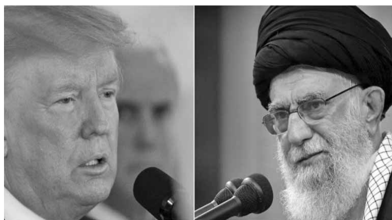
Ο Αμερικανός πρόεδρος Ντόναλντ Τραμπ και ο Ιρανός ΥΠΕΞ Μοχάμαντ Τζαβάντ Ζαρίφ.

Τρεις πηγές ανέφεραν, όπως μεταδίδει το ΑΠΕ από το Reuters, πως το Ιράν θεωρείται ότι επιχείρησε να πληξεί συγκεκριμένα τμήματα των βάσεων για να ελαχιστο-