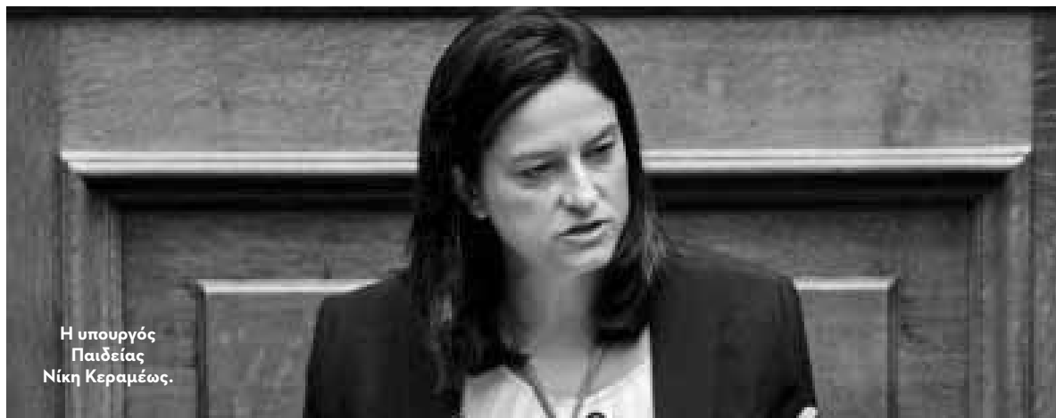
Η υπουργός Παιδείας Νίκη Κεραμέως.

Γ ια «νέα εποχή αναβάθμισης και εξωστρέφειας των Ανώτατων Εκπαιδευτικών μας Ιδρυμάτων» έκανε λόγο η υπουργός Παιδείας μετά τις επαφές που είχε στις ΗΠΑ. Συμμετέχοντας στην ελληνική αντιπροσωπεία υπό τον πρωθυπουργό, Κυριάκο Μητσοτάκη, η κ. Κεραμέως είχε συγκεκριμένα σειρά επαφών με την υφυπουργό Παιδείας και Πολιτισμού, Marie Royce, με στελέχη κορυφαίων Αμερικανικών πανεπιστημίων στην Ουάσιγκτον, καθώς και με εκπροσώπους της Γερουσίας και της Βουλής των Αντιπροσώπων.