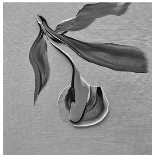
Έργο του Γιάννη Καμίνη.

Η γκαλερί Art Zone 42 παρουσιάζει την ομαδική έκθεση «20/20 High Vision». Η νέα χρονιά του 2020 που ανοίγει μια νέα δεκαετία, φέρει έναν αριθμό με έντονο συμβολισμό που παραπέμπει στη μονάδα μέτρησης της οπτικής οξύτητας στην οφθαλμολογία, καθώς το 20/20 είναι η μέτρηση της απόλυτης οξείας όρασης σε έναν φυσιολογικό άνθρωπο.