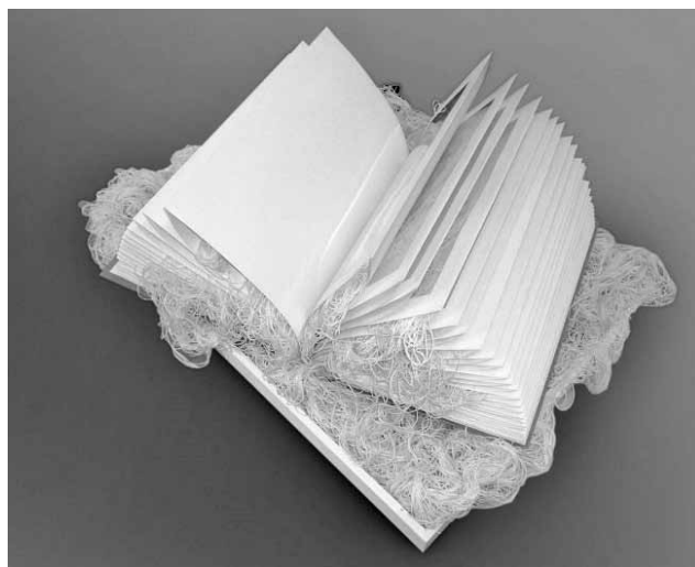
Έργο της Μαρίας Σταμάτη.