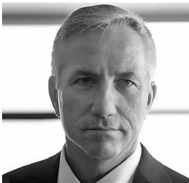
Ο διευθύνων σύμβουλος του ΟΤΕ, Μιχάλης Τσαμάζ.

«Ακούγονται πολλά για τις αλλαγές που θα έρθουν στην εταιρεία μας. Πάντα σας μιλούσα ανοιχτά και με ειλικρίνεια. Θέλω λοιπόν και τώρα να ενημερωθείτε από εμένα. Γιατί το μέλλον της εταιρείας μας, μας αφορά όλους, άμεσα», ανέφερε στο μήνυμά του ο κ. Τσαμάζ. Κάνοντας μια σύντομη αναδρομή, ο επικεφαλής του ΟΤΕ σημείωσε πως, ο Όμιλος ΟΤΕ είναι σήμερα κορυφαία εταιρεία τεχνολογίας στην Ελλάδα και αναπόσπαστο κομμάτι του κοινωνικού και παραγωγικού ιστού της χώρας. Μία υγιής εταιρεία που μπορεί να ανταποκρίνεται στις προσδοκίες