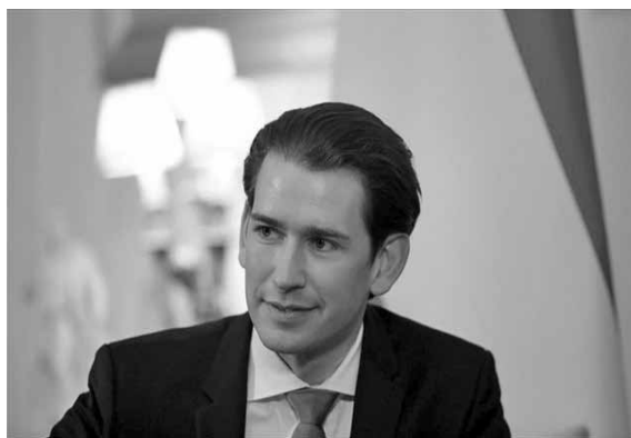
Ο ομοσπονδιακός καγκελάριος της Αυστρίας Σεμπάστιαν Κουρτς.

Όπως παρατήρησε, σε όλο τον κόσμο 100 εκατομμύρια άνθρωποι βρίσκονται σε φυγή «και αυτό δεν είναι υπερβολή, αλλά η πραγματικότητα», και σε περίπτωση που υπάρξει μία επέλαση στα σύνορά της, η Αυστρία είναι προετοιμα-