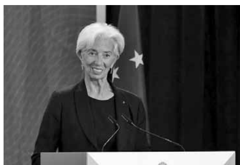
Η Πρόεδρος της ΕΚΤ, Κριστίν Λαγκάρντ.

2) Να επεκταθεί το φάσμα των επιλέξιμων περιουσιακών στοιχείων στο πλαίσιο του προγράμματος αγοράς του εταιρικού τομέα (CSPP) σε μη χρηματοοικονομικούς τίτλους και έτσι όλα τα εταιρικά ομόλογα επαρκούς πιστωτικής ποιότητας είναι επιλέξιμα για αγορά.