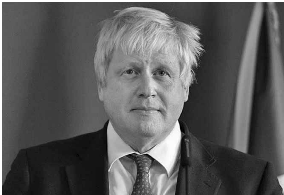
Ο πρωθυπουργός της Μ. Βρετανίας, Μπόρις Τζόνσον.

Μέτρα αντιμετώπισης της πανδημίας ανακοίνωσε σε διάγγελμά του ο Μπόρις Τζόνσον, όπως μεταδίδει το BBC αλλάζοντας άρδην την μέχρι τώρα τακτική του. Ποια είναι τα βασικά σημεία: