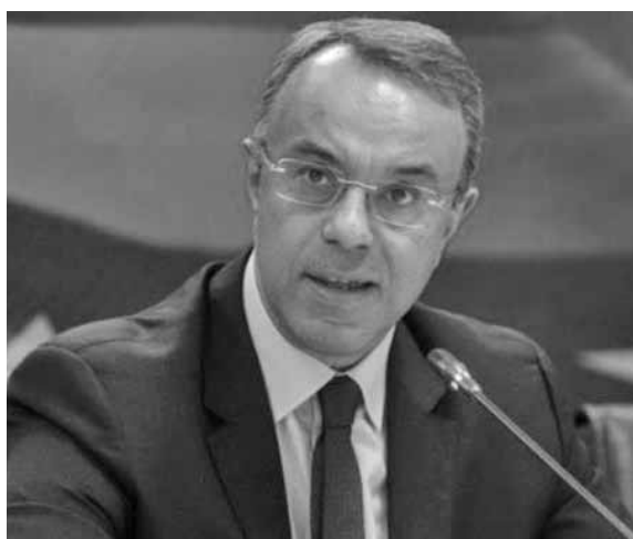
Ο υπουργός Οικονομικών Χρήστος Σταϊκούρας

«Η ρήτρα αυτή, που θεσπίστηκε το 2011, ενεργοποιείται για πρώτη φορά, σηματοδοτώντας την ισχυρή βούληση των θεσμικών οργάνων της Ευρωπαϊκής Ένωσης και των Υπουργών Οικονομικών των κρατών-μελών της να αξιοποιήσουν στον μέγιστο