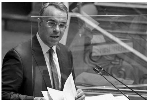
Ο υπουργός Οικονομικών, Χρήστος Σταϊκούρας.

Ο κ. Σταϊκούρας επισήμανε πως προωθήθηκε το πρόγραμμα αξιοποίησης της δημόσιας περιουσίας, όπου αυτό ήταν εφικτό, όπως είναι το έργο στο Ελληνικό, η μαρίνα Αλίμου και η αξιοποίηση τριών περιφερειακών λιμένων, ενώ δρομολογήθηκαν σχέδια ενίσχυσης της