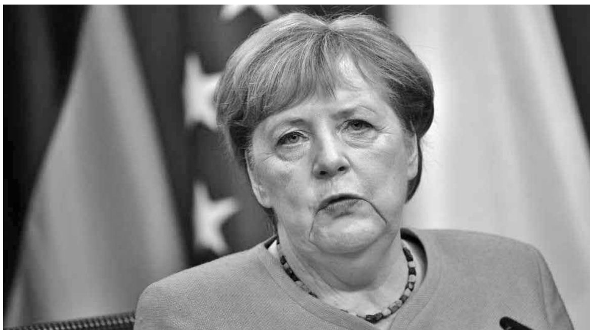
Η Καγκελάρια της Γερμανίας Άγκελα Μέρκελ.

Τ ην ίδια ώρα η Καγκελάρια της Γερμανίας Άγκελα Μέρκελ τόνισε ότι η στήριξη προς την Ελλάδα όσον αφορά το προσφυγικό και τη Μόρια πρέπει να οργανωθεί σε ευρωπαϊκό επίπεδο, μετά από σχετική ερώτηση στην κοινή συνέντευξη τύπου με τον Πρόεδρο του Ευρωπαϊκού Συμβουλίου και την Πρόεδρο της Κομισιόν μετά την τηλεδιάσκεψη των ηγετών ΕΕ-Κίνας.