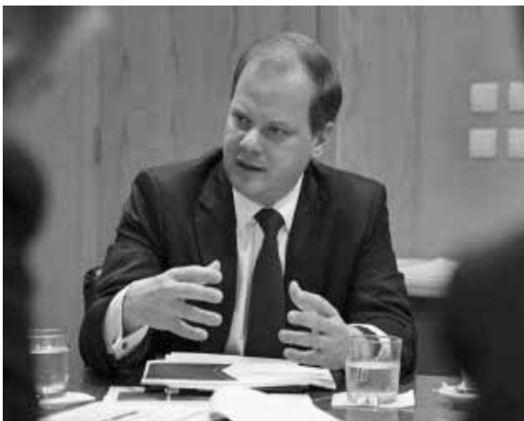
Ο υπουργός Μεταφορών και Υποδομών Κώστας Καραμανλής.

«Όλοι πρέπει να φοράνε μάσκα στα ΜΜΜ» έσπευσε όμως να υπενθυμίσει.