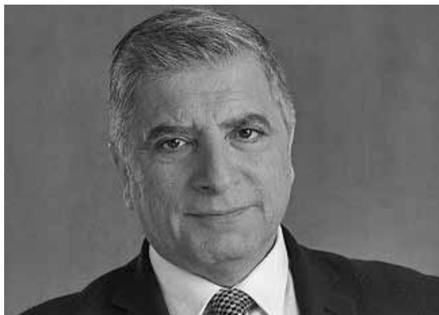
Ο περιφερειάρχης Αττικής, κ. Πατούλης.

Κατά συνέπεια, η ελληνική οικονομία στηρίζεται σχεδόν απο-