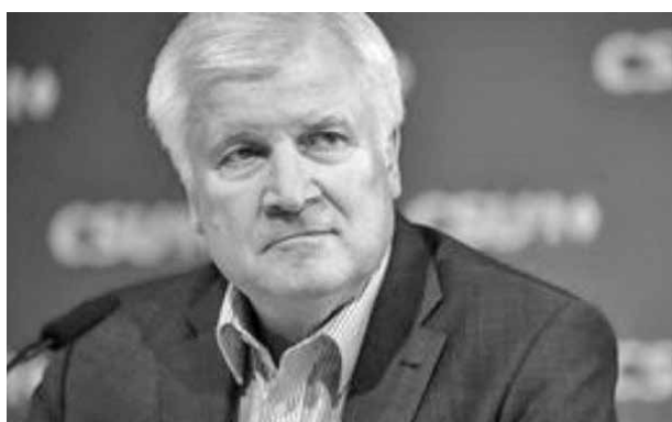
Ο Γερμανός υπουργός Εσωτερικών Χορστ Ζεεχόφερ.

Σύμφωνα με την εφημερίδα, ο κ. Σπαν κάλεσε την Τετάρτη, κατά τη διάρκεια της συνεδρίασης του υπουργικού συμβουλίου, τα μέλη της κυβέρνησης που είναι άνω των 60 ετών να εμβολιαστούν με AstraZeneca, προκειμένου να συμβάλουν στην οικοδόμηση εμπιστοσύνης για το συγκεκριμένο εμβόλιο. Η πρόσκληση αφορούσε την καγκελάρια Ανγκελα Μέρκελ (66 ετών), τον αντικαγκελάριο και υπουργό Οικονομικών Όλαφ Σολτς (62), τον υπουργό Εσωτερικών Χορστ Ζεεχόφερ (71), τον υπουργό Οικονομίας Πέτερ Αλτμπίερ (62) και τον υπουργό Αναπτυξιακής Συνεργασίας Γκερντ Μιούλερ (65). Ανάλογη πρόσκληση είχε απευθύνει ο υπουργός Υγείας και στους πρωθυπουργούς των κρατιδίων. «Θα το κάνω αμέσως μόλις έρθει η σειρά μου -και με AstraZeneca», δήλωσε ο 62χρονος πρωθυπουργός της Κάτω Σαξονίας Στέφαν Βάιλ μέσω της εκπροσώπου του, η οποία διευκρίνισε ωστόσο ότι το κρατίδιο δεν έχει φθάσει ακόμη στον εμβολιασμό της ηλικιακής ομάδας 60-69 ετών. Πάντως ο 65χρονος Ομοσπονδιακός Πρόεδρος Φρανκ-