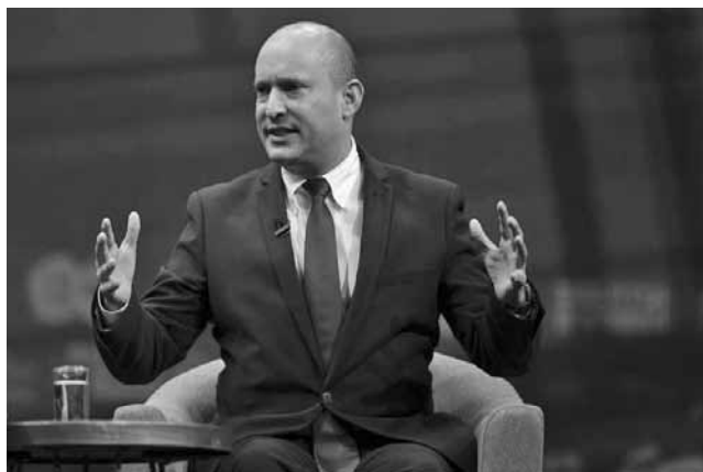
Ο ηγέτης της ισραηλινής αντιπολίτευσης Γιαΐρ Λαπίντ.

Η ισραηλινή προεδρία ανακοίνωσε πως στην αρχή της θητείας της νέας κυβέρνησης, ο πρόεδρος του κόμματος Γιαμίνια, Ναφτάλι Μπένετ θα διατελέσει πρωθυπουργός και ο Λαπίντ αντιπρόεδρος της κυβέρνησης και μετά από σχεδόν δύο χρόνια θα υπάρξει εναλλαγή και ο Λαπίντ θα αναλάβει τον πρωθυπουργικό θώκο και ο Μπένετ θα γίνει αντιπρόεδρος της κυβέρνησης. «Σας υπόσχομαι κύριε πρόεδρε πως η κυβέρνηση θα λειτουργήσει με τρόπο που να υπηρετεί όλους τους πολίτες του Ισραήλ, συμπεριλαμβανομένων και εκείνων που δεν αποτελούν μέλη της, θα σέβεται όλους της αντιτίθενται και θα κάνει τα πάντα ώστε να ενώνει κομμάτια της ισραηλινής κοινωνίας» έγραψε ο Λαπίντ στην επίσημη ενημέρωση προς τον Ισραηλινό πρόεδρο Ρεουβέν Ρίβλιν. Μπένετ και Λαπίντ συναντήθηκαν με τον Μανσοφ Αμπάς, επικεφαλής του αραβικού κόμματος του Ισραήλ και κατάφερε να έρθει σε συμφωνία, την πρώτη στην οποία συμμετέχει αραβική παράταξη στην πολιτική ιστορία της χώρας. Ο Αμπάς πρόσθεσε αιτήματα της τελευταίας στιγμής, έπειτα από σειρά συζητήσεων και με τον απερχόμενο