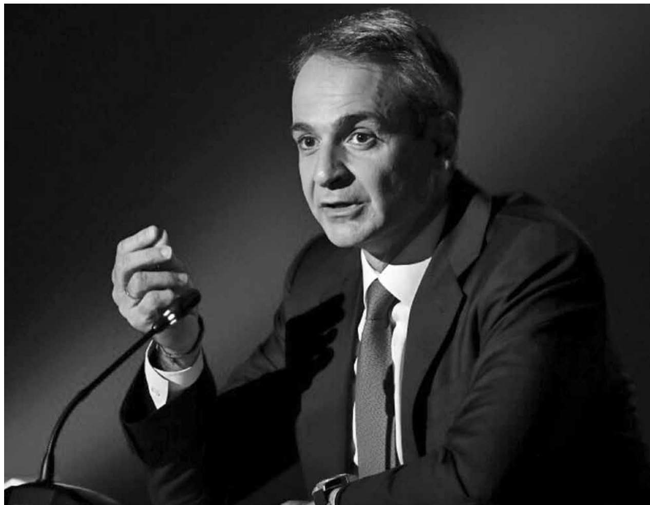
Ο πρωθυπουργός κ. Κυριάκος Μητσοτάκης.

Πακέτο φοροελαφρύνσεων ετοιμάζει η Κυβέρνηση ενόψει της ΔΕΘ. Ήδη τρεις μειώσεις φόρων έχουν "κλειδώσει" για το 2022, και ακόμα δύο βρίσκονται υπό εξέταση. Με τρεις αποφασισμένες φοροελαφρύνσεις στις βαλίτσες του θα ανέβει στη Θεσσαλονίκη ο Πρωθυπουργός για την Διεθνή Έκθεση.