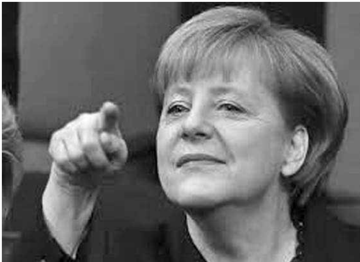
Η καγκελάρια Ανγκελα Μέρκελ.

Ν α μην κοιτάνε κάθε μέρα τους αριθμούς, διότι αυτό που μετράει τελικά είναι οι ψήφοι της κάλπης, συμβούλεψε τους Χριστιανοδημοκράτες και τους Χριστιανοκοινωνιστές (CDU / CSU) η καγκελάρια Μέρκελ μετά το ιστορικό χαμπλό τους στην τελευταία δημοσκόπηση. «Εγερτήριο σάλπισμα», χαρακτήρισε την δημοσκόπηση ο γ.γ. του κόμματος Πάουλ Τσίμακ.