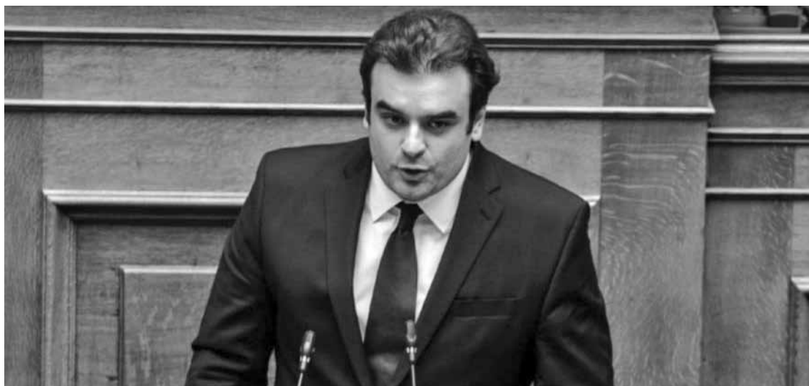
Ο υπουργός Επικρατείας και Ψηφιακής Διακυβέρνησης, Κυριάκος Πιερρακάκης.

Ε κατόν πενήντα εκατομμύρια ψηφιακές συναλλαγές έγιναν το πρώτο εξάμηνο του 2021 ενώ το 2018 είχαν γίνει 8,8 εκατ. ψηφιακές συναλλαγές, το 2019 34 εκατ., και το 2020 94 εκατ., τόνισε ο υπουργός Επικρατείας και Ψηφιακής Διακυβέρνησης, Κυριάκος Πιερρακάκης, μιλώντας στη θεματική ενότητα, με θέμα «Σχέση πολίτη - δημοσίου, η νέα ψηφιακή εποχή και οι προκλήσεις της», του Thessaloniki Helexpro Forum, που πραγματοποιείται στο πλαίσιο της 85ης ΔΕΘ.