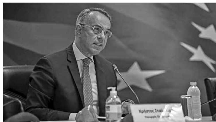
Ο υπουργός Οικονομικών Χρήστος Σταϊκούρας

Ε πιδότηση 18 αντί 9 ευρώ το μήνα ανά λογαριασμό ρεύματος και έως 24 ευρώ για δικαιούχους Κοινωνικού Οικιακού Τιμολογίου, αλλά και διεύρυνση των δικαιούχων επιδόματος θέρμανσης εν συγκρίσει με πέρυσι, περιλαμβάνει το νέο πακέτο κατά των επιπτώσεων της ενεργειακής κρίσης που ανακοίνωσαν απο κοινού ο υπουργός Οικονομικών Χρήστος Σταϊκούρας, ο υπουργός Περιβάλλοντος Κώστας Σκρέκας και ο αναπληρωτής υπουργός Οικονομικών Θεόδωρος Σκυλακάκης σε συνέχεια όσων είχε εξαγγείλει πριν ένα μήνα από την ΔΕΘ ο πρωθυπουργός, Κυριάκος Μητσοτάκης. Το πακέτο στήριξης των νοικοκυριών λόγω των ανατιμήσεων στην ενέργεια φτάνει τα 500 εκατ. ευρώ.