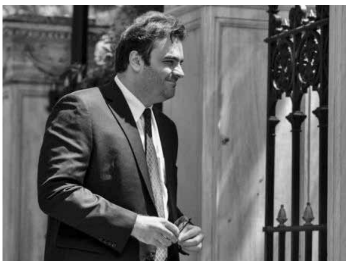
Ο υπουργός Ψηφιακής Διακυβέρνησης, Κυριάκος Πιερρακάκης.

«Είναι πολύ σπουδαίο για το ΕΣΥ να έχει αυτόν τον φάκελο και για τους πολίτες να έχουν ιδιοκτησία στα πράγματα που τους αφορούν» σημείωσε και εξήγησε ότι δεν