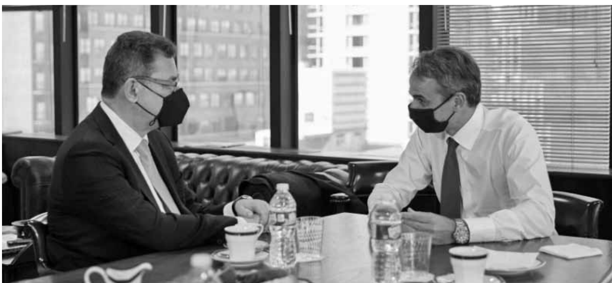
Ο Έλληνας επικεφαλής της Pfizer, Αλμπέρτ Μπουρλά, με τον πρωθυπουργό Κυριάκο Μητσοτάκη.

Ε γκαινιάστηκαν οι νέες εγκαταστάσεις του παγκόσμιου Κέντρου Ψηφιακής Καινοτομίας και του παγκόσμιου Κέντρου Επιχειρησιακών Λειτουργιών και Υπηρεσιών της Pfizer, στη Θεσσαλονίκη, ενώ το «παρών» έδωσε και ο πρωθυπουργός Κυριάκος Μητσοτάκης ο οποίος απύθνησε χαιρετισμό.