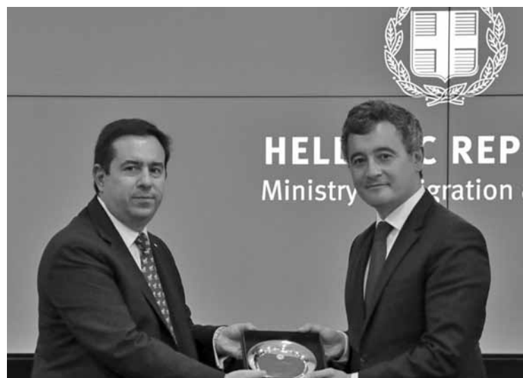
Ο Γάλλος υπουργός Εξωτερικών Gerald Darmanin, με τον υπουργό Μετανάστευσης και Ασύλου Νότη Μητράκη.

Όπως είπε στην τοποθέτησή του ο Darmanin ο οποίος επισκέφθηκε και την νέα κλειστή δομή στην Σάμο, έκανε λόγο για πλήρη αποτελεσματικότητα των υπηρεσιών της ελληνικής κυβέρνησης στην καταπολέμηση της παράνομης μετανάστευσης, ενώ τόνισε πως «γνωρίζουμε καλά στη Γαλλία ότι οι Έλληνες όχι μόνο προστατεύουν τα σύνορά τους αλλά προστατεύουν ολόκληρη την Ευρώπη». Παράλληλα ο Γάλλος υπουργός Εξωτερικών δεσμεύθηκε ότι πρέπει να διασφαλιστεί πως η Frontex θα λάβει τους απαραίτητους ανθρώπινους και υλικούς πόρους ώστε «με εξαιρετικά