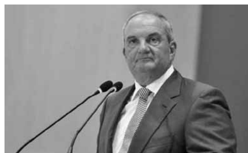
Ο Κωνσταντίνος Καραμανλής.

«Η Ελλάς ανήκει και επιθυμεί να ανήκει εις την Ευρώπη όπου την έχουν τοποθετήσει η γεωπολιτική της θέση, η ιστορία και η παράδοσή της και δεν επιθυμεί την ένταξή της αποκλειστικώς και μόνον για λόγους οικονομικούς. Την επιδιώκει προπάντων για λόγους πολιτικούς που αναφέρονται εις την σταθεροποίηση της Δημοκρατίας και εις το μέλλον του έθνους», είπε ο πρωθυπουργός.