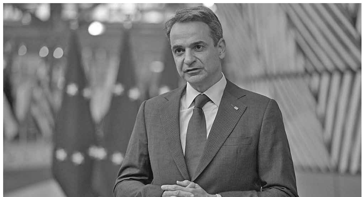
Ο πρωθυπουργός Κυριάκος Μητσοτάκης.

«Κρατώ από τις παρατηρήσεις της Επιτροπής κάτι το οποίο το θεωρώ ιδιαίτερα σημαντικό και θα το υιοθετήσουμε και εμείς: Τη δυνατότητα να μπορέσουν οι συμπολίτες μας, οι οποίοι θα δουν ενδεχομένως μία απότομη αύξηση στο κόστος θέρμανσης, να αποπληρώσουν τις υποχρεώσεις τους εντός εύλογου χρονικού διαστήματος, μέσω ενός συστήματος ρυθμίσεων, έτσι ώστε να μην είναι πολύ μεγάλη η οικονομική επιβάρυνση κατά τη διάρκεια του χειμώνα». Παράλληλα, ο Κυριάκος Μητσοτάκης σημείωσε ότι θα πρέπει να εξεταστούν προτάσεις «όπως η δυνατότητα αγο-